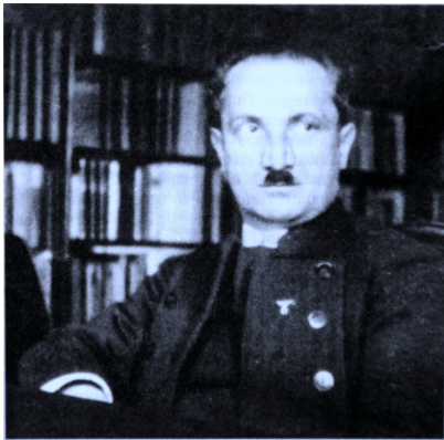
Martin Heidegger à Fribourg en 1933

Trước mắt chúng ta là tấm ảnh chụp Martin Heidegger năm 1933. Lúc ấy ông bốn mươi bốn tuổi, vừa nhậm chức Hiệu trưởng Trường Đại học Fribourg và danh tiếng của ông đã vượt ra ngoài biên giới nước Đức sau khi công bố tác phẩm "Hữu Thể và Thời Gian". Tấm ảnh trắng đen, có lẽ được chụp trong phòng làm việc. Chúng ta thấy Martin trong bộ suit đen, bên ngoài khoác chiếc áo dạ, loại trang phục mà các sĩ quan Đức thời ấy thường mặc. Ba chiếc khuy đồng trên áo sáng lấp lánh bên cạnh chiếc huy hiệu Đức Quốc Xã. Phía sau Martin, trong ánh sáng mờ nhạt, là dãy kệ chất đầy sách. Martin không nhìn thẳng vào ống kính, mắt ông hướng về phía sau chúng ta.